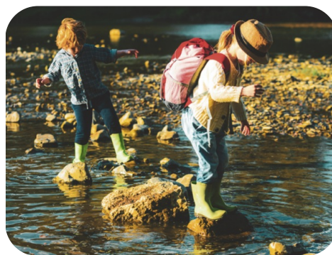
L'île aux enfants de Lalinde