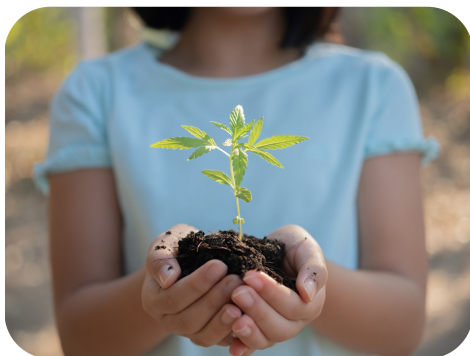
Les galopins de Beaumontois en Périgord